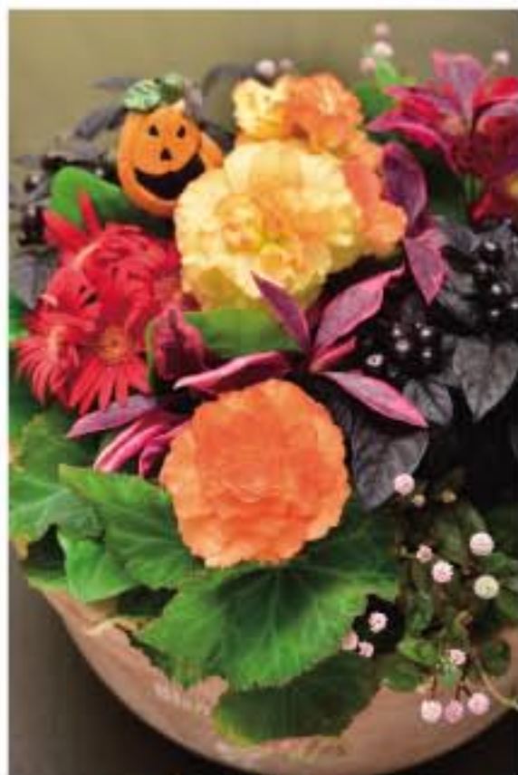
① フォーチュンをつかったハロウィンカラーの寄せ植え