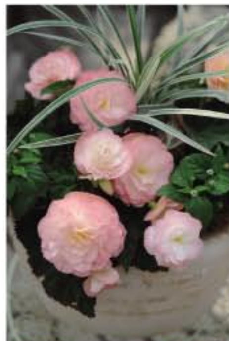
④ ピンクのフォーチュンを使った寄せ植え