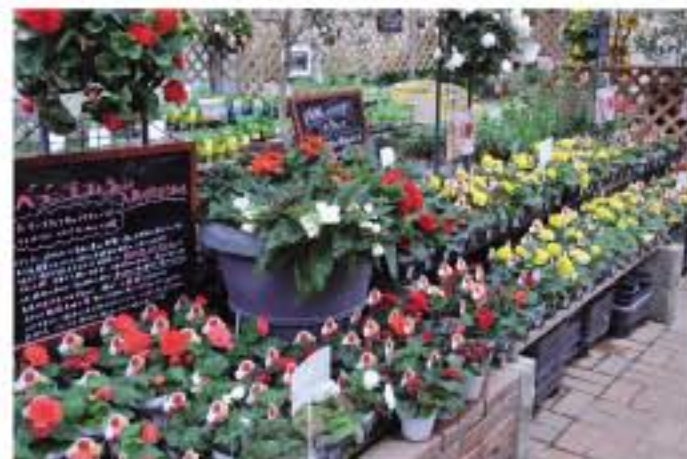
③ 苗売場もフォーチュンたっぷりになっています。色も常時5~8色あります。