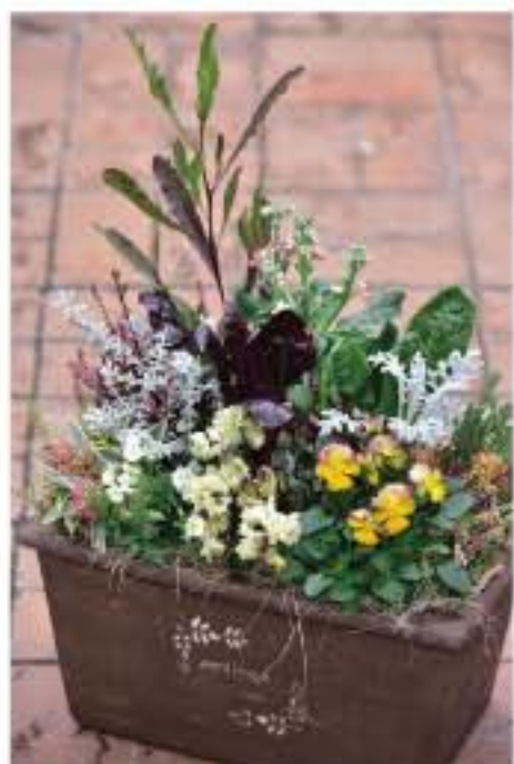
② ガーデンシクラメン イエローの薨の妖精をつかった寄せ植え

これだけ私たちもオススメしている花ですので、フォーチュンのすごさを実感されたお客様も増えてきました。素晴らしいパフォーマンスを見せてくれるので、まだ植えられたことのない方にはぜひ楽しんでいただきたい花です。(10月後半までの入荷予定です)