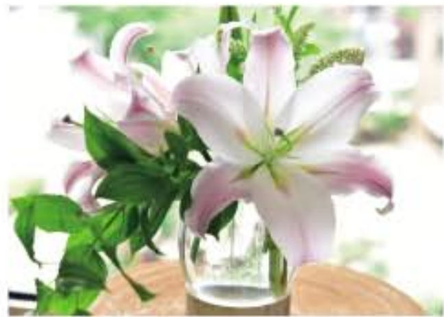
① スーパーマスターとリキウソウ、ヒメリョウブ