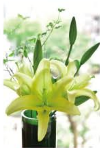
② イエローウィンとドウダン