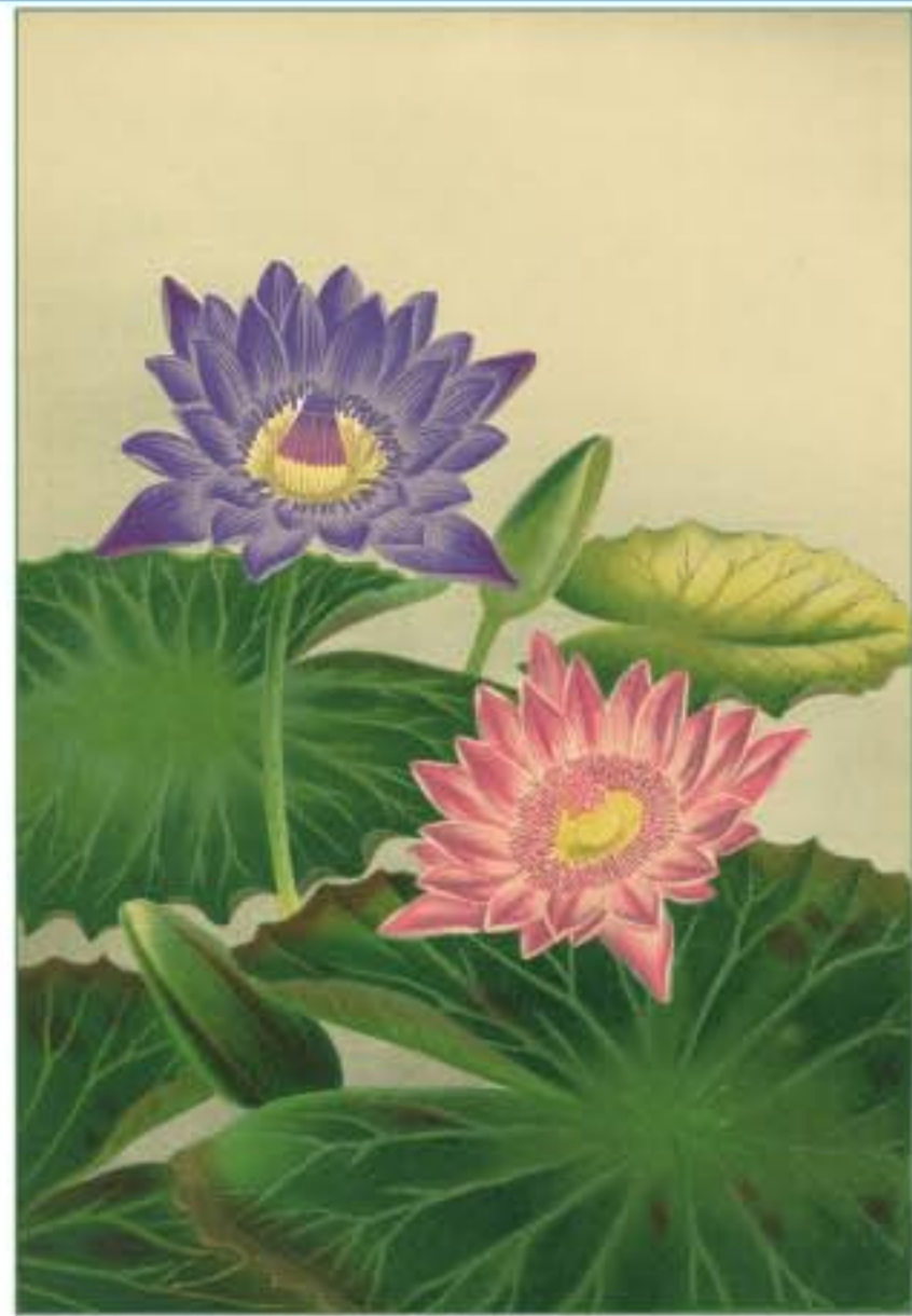
熱帯睡蓮 園芸植物図譜 式ノ一 より 大正3年(1914) 横浜植木株式会社編並びに刊 図 左: Nymphaea zanzibarensis var. azurea 図 右: Nymphaea rubra var. rosez