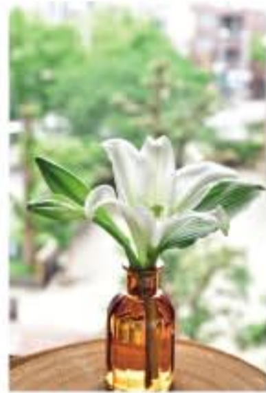
③ テッポウユリとギボウシ

夏の光を感じられる6月、今月のバースデーフラワーは「百合(ユリ)」をご紹介します。 百合(ユリ)は、すらりとした茎に白やピンク、黄色など香りの強い大ぶりの花を咲かせるユリ科の球根植物です。百合の花名は、風が吹くと花が揺れるところから「揺すり」と言われ、それが変化して「百合(ユリ)」と呼ばれるようになりまし。漢字の「百合」は、百合の花の鱗片がたくさん重なっているところからきていと言われています。