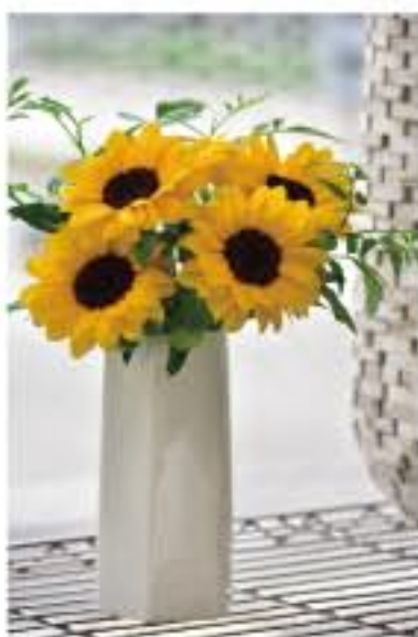
③ ヒマワリとソケイ