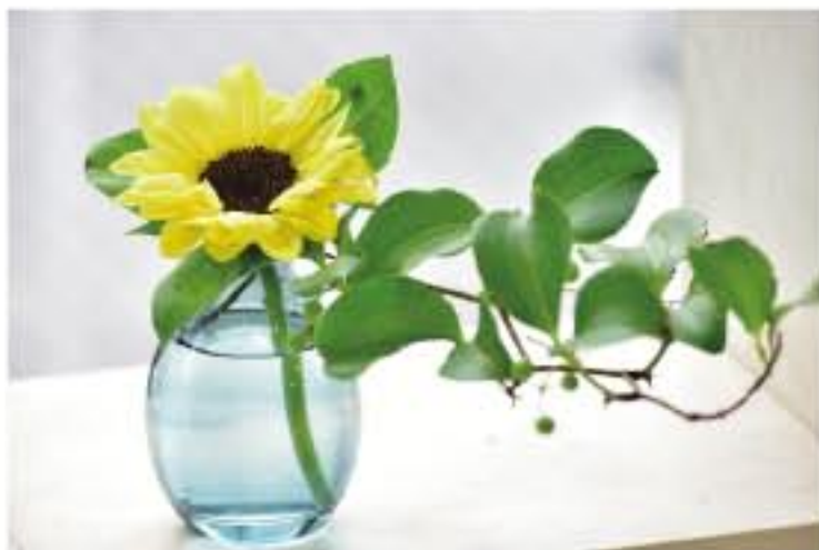
② ヒマワリとサンキライ