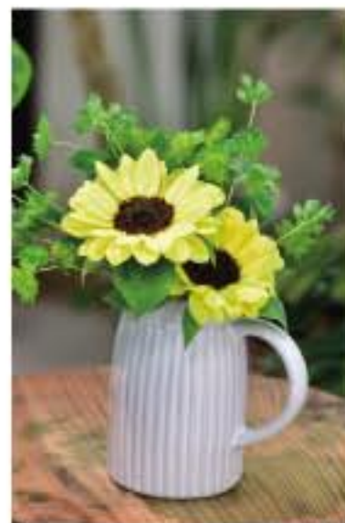
④ ヒマワリとブレイクサム

今月7月におすすめのバースデーフラワーはヒマワリです。ヒマワリは北アメリカ原産のキク科の1年草です。すっと立ちあがった茎から太陽のような大輪の花を咲かせます。開花期は主に7～9月。夏を代表する花は？と聞かれたら、ヒマワリを思い浮かべる方が多いのではないのでしょうか。青空と太陽が似合う大きな黄色い花は、夏の象徴としてたくさんの歌や絵画の題材にもなり、誰もが知る花の1つです。ヒマワリの和名は「向日葵」。「日輪草(ニチリンソウ)」「日車(ヒグルマ)」などと呼ばれ、どの名前も太陽に由来します。また、太陽を象徴する花であることから、英語では「Sunflower(太陽の花)」と呼ばれています。