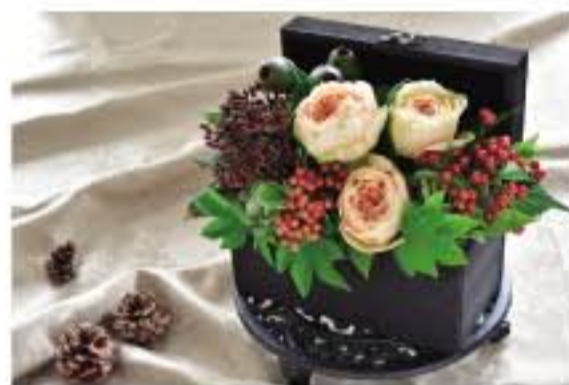
① ピバーナムとユーカリのオータムアレンジ

つば状の実が特徴的です。コロんとした実は可愛らしく、存在感があります。その他のユーカリや動きのあるものと合わせても相性が良いです。