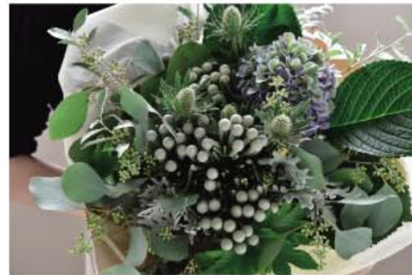
② シルバープルニアとシルバーリーフのブーケ

コロナ禍でなかなか会う事の出来ない方へ、今月は秋の訪れとともに「実物」を添えたフラワーギフトはいかがでしょう。