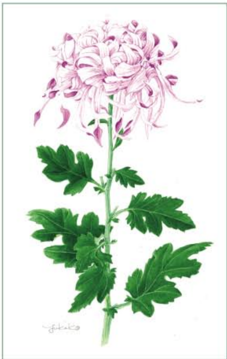
江戸菊 '花散里' 画/植田由喜子

今秋も10月下旬から11月中旬に江戸菊、伊勢菊、嵯峨菊、肥後菊、丁字菊など伝統菊と現代菊の開花株を店頭展示いたします。 亮軒記