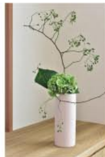
③ 野ばらと秋色アジサイ & フラワーベース