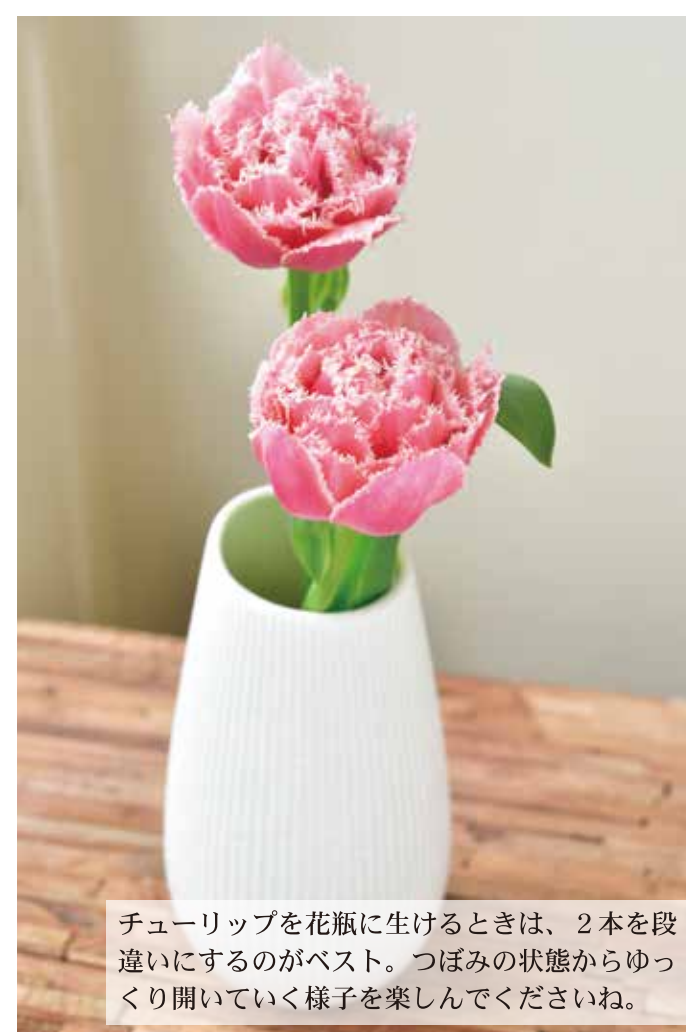
チューリップを花瓶に生けるときは、2本を段違いにするのがベスト。つぼみの状態からゆっくり開いていく様子を楽しんでくださいね。