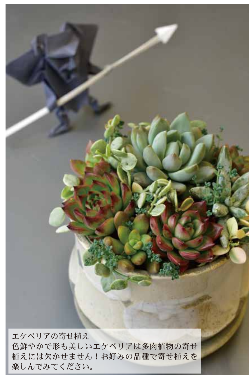
エケベリアの寄せ植え 色鮮やかで形も美しいエケベリアは多肉植物の寄せ植えには欠かせません!お好みの品種で寄せ植えを楽しんでみてください。

この機会に自分好みの色や形のお気に入りの品種を見つけ、寒い季節でも色鮮やかに楽しめるエケベリアぜひ育ててください。