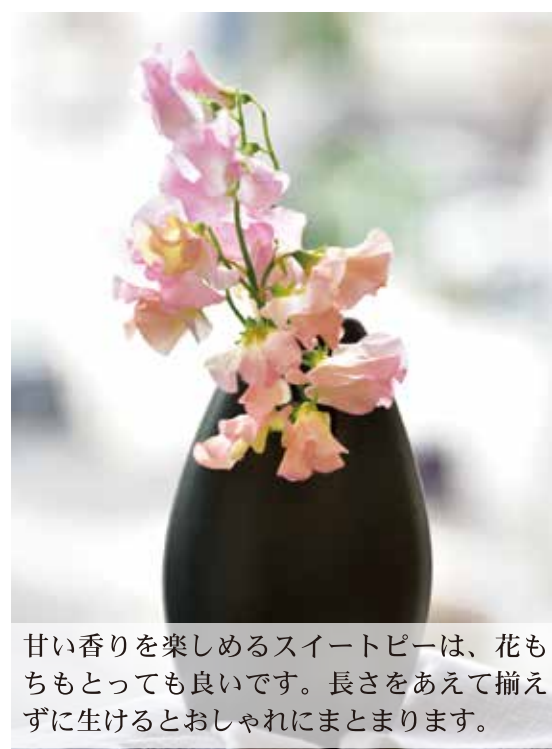
甘い香りを楽しめるスイートピーは、花もちもとっても良いです。長さをあえて揃えずに生けるとおしゃれにまとまります。