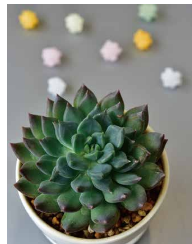
エケベリア ダークエルフ 暑さと湿度が苦手なので風通しの良い場所で育てましょう。水やり後に葉と葉の間に水が溜まってないかチェックも忘れずに!

エケベリアは約200種類の原種が知られています。その8割がメキシコに分布し、その他に中米や南米にも分布しています。主に乾燥地域の山や丘の斜面の岩や石のくぼみに自生しています。