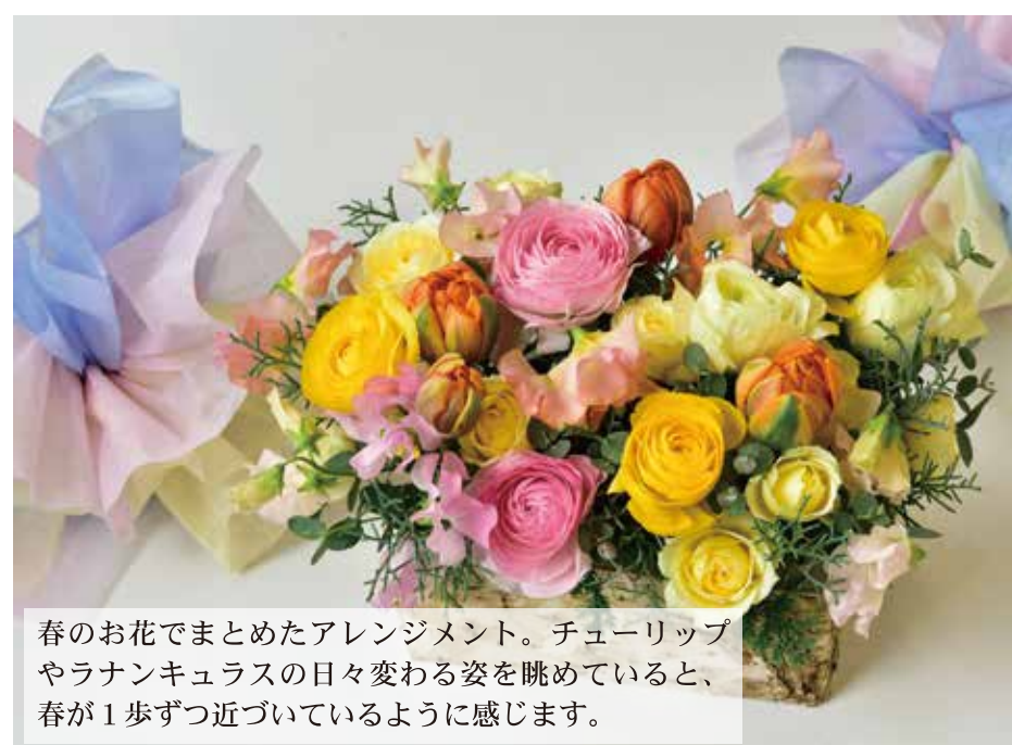
春のお花でまとめたアレンジメント。チューリップやラナンキュラスの日々変わる姿を眺めていると、春が1歩ずつ近づいているように感じます。