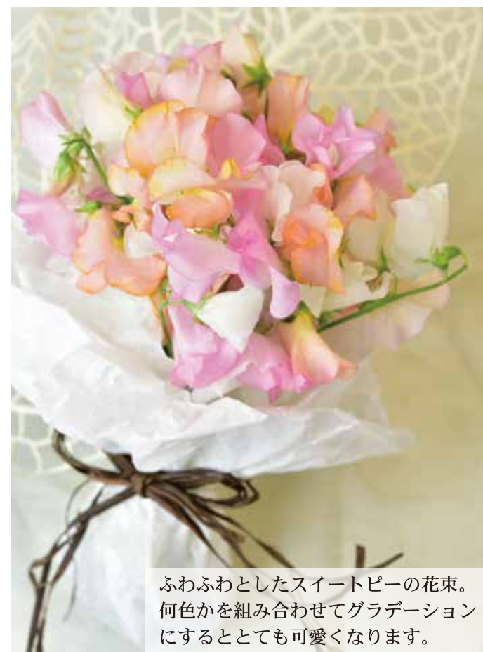
ふわふわとしたスイートピーの花束。何色かを組み合わせてグラデーションにするととても可愛くなります。