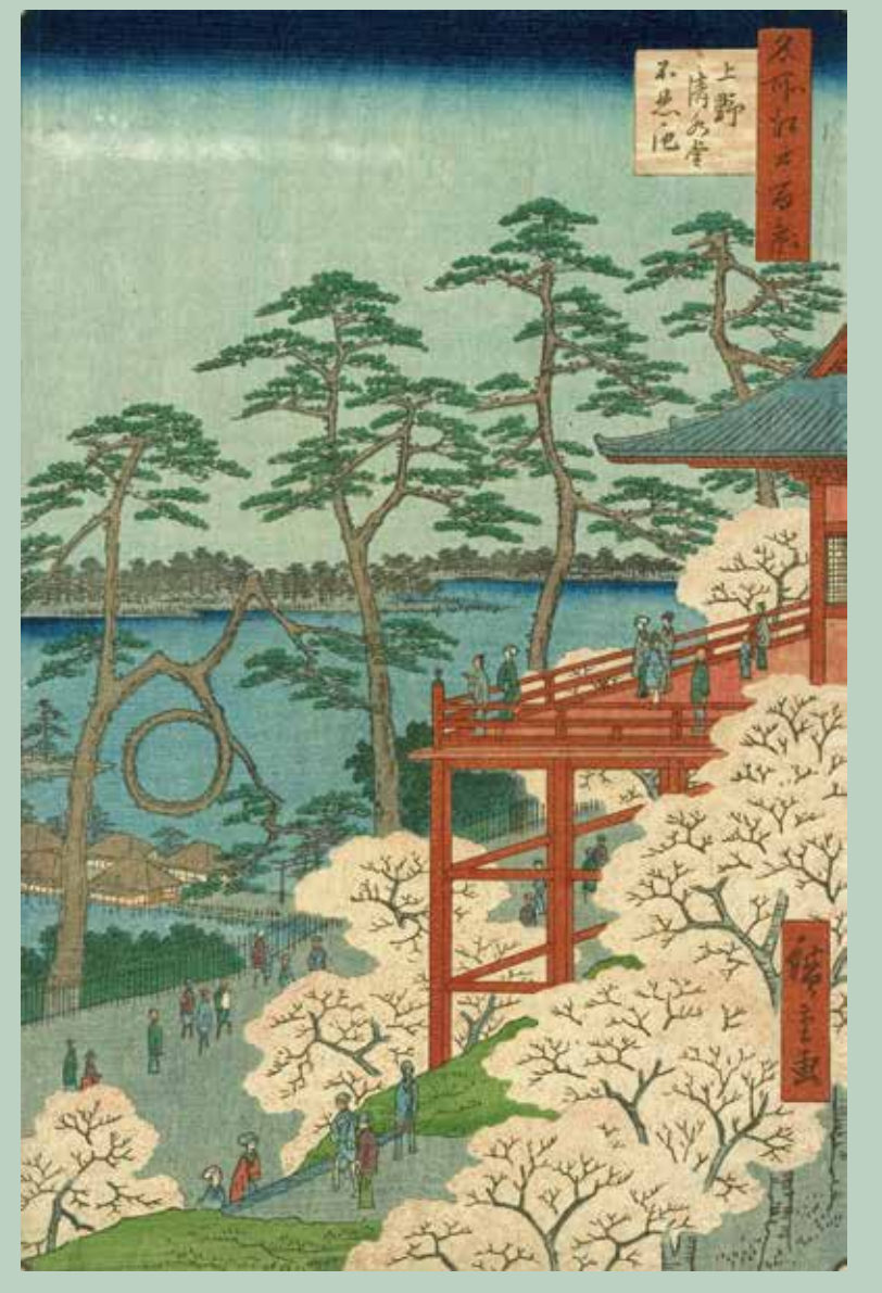
『名所江戸百景 上野清水堂不忍池』／歌川広重（初代）画 安政3年（1856年）

上野山の高台から、清水観音堂の舞台・不忍池・弁天島・池之端の町並みを一望する視点で描かれています。満開の桜と清水観音堂の舞台の左手前には大きく張り出した松の枝が配されています。この枝は弓なりに反り返り、丸く輪をつくるように見えることから「月の松」と呼ばれました。