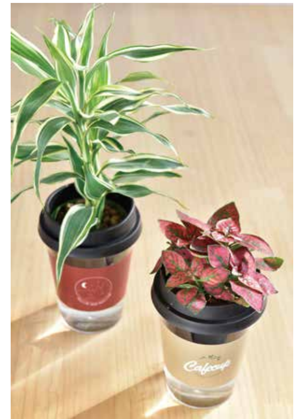
④ ドラセナ/ヒゴエステス（左・右）¥1,300 (税込 ¥1,430) 透明な器なのでお手入れが簡単。特別価格にてご案内いたします。