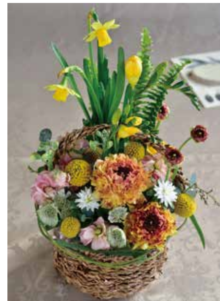
② 春まち球根アレンジメント ¥5,000 (税込 ¥5,500)