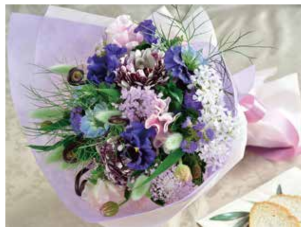
① エアリーシック スプリングブーケ ¥5,000 (税込 ¥5,500)

3月の花贈りは「華やかさ」よりも「季節感」と「やさしさ」を大切に。誕生日という特別な日に、春の始まりを束ねた花を添えてみませんか。