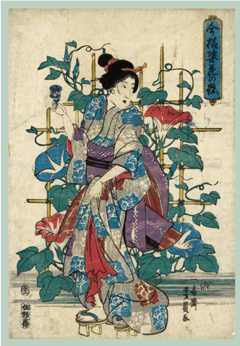
『今様姿花の粧 朝顔と美女』 一寿斎芳員

盛夏を象徴する大輪の朝顔が画面いっぱいに咲き誇り、その前に立つ女性の姿が優雅に表現されています。女性が手にしているのは、朝顔の花を数輪重ねたもののように見え、誰かに手渡そうとしている場面とも受け取れます。朝顔のつるの巻き付きの描写や、竹格子に絡む誇張された花の大きさなど、細部にまで芳員の確かな筆致がうかがえます。