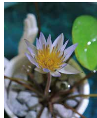
熱帯スイレン 'ドウベン'

今回はさまざまな品種の熱帯スイレンを展示販売いたします。品種ごとの花色・花形、葉の雰囲気の違いも楽しめます。この機会に、夏の楽しみをまたひとつ増やしてみませんか。