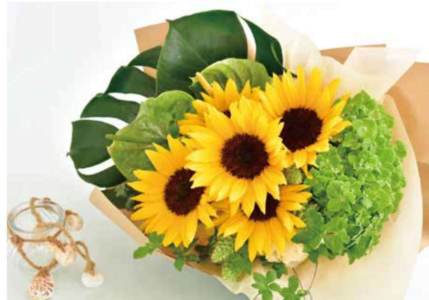
◇ヒマワリのブーケ「大暑」 ¥6,000（税込 ¥6,600）

当店では、鮮やかなヒマワリを主役に、ブルー系の花や涼やかなグリーンを合わせた季節感あふれるアレンジメントをご用意しました。見ているだけで元気をもらえるような明るい表情と、暑い季節に心地よい清涼感をお楽しみいただけます。