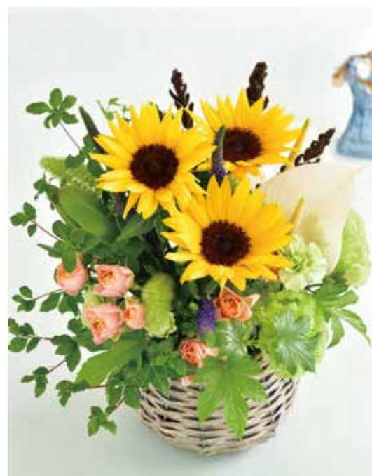
◇ヒマワリのアレンジメント「小暑」 ¥5,000（税込 ¥5,500）

7月は二十四節気という「小暑」と「大暑」の季節です。梅雨明けが近づき、本格的な夏の訪れを感じる頃。青空に向かって力強く咲くヒマワリは、そんな夏を象徴する花として親しまれています。